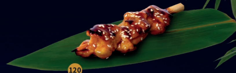
120 Yakitori Chicken