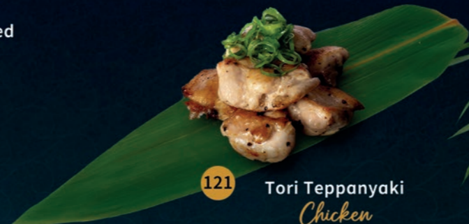
121 Tori Teppanyaki Chicken