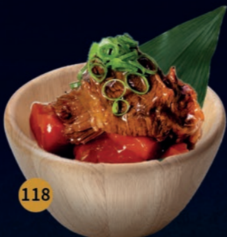
118 Slow Cooked Beef