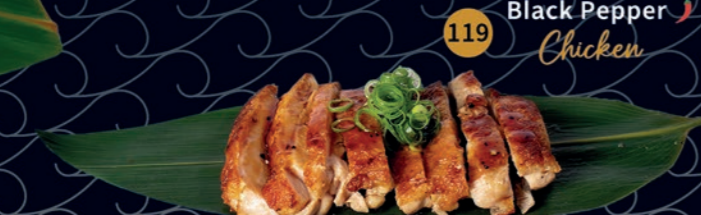
119 Black Pepper Chicken